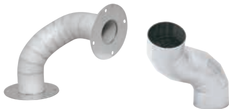
● 特殊エルボ 特殊な形状のエルボや曲がり管を製作します。