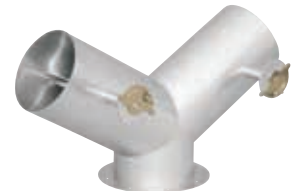
● ダンパ付Y管 Y管やT管にダンパを溶接します。