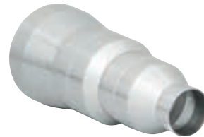
● 異径管 各口径のレジャーサを組み合わせることにより異径管を製作します。