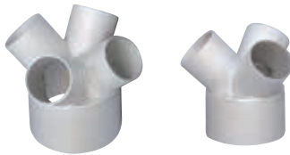
● 分岐管 三分岐、四分岐等を各口径で製作します。