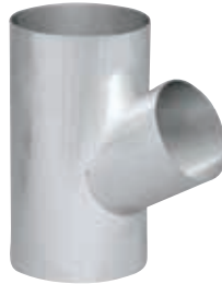
● ト管 各口径のト管を製作します。