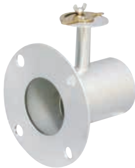
● JIS5K相当ピッチフランジ付D型ダンパ 各種管材にJIS5K相当ピッチのフランジ (t=2.0mm程度)を取り付けます。