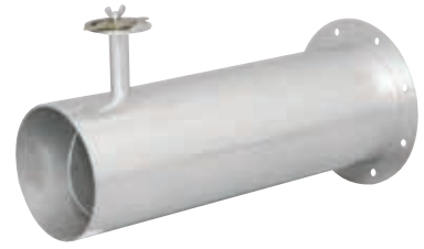
● ロング片フランジ付D型ダンパ 片フランジ付D型ダンパのロングタイプです。 ご指示いただいたロング寸法にてダンパを製作します。