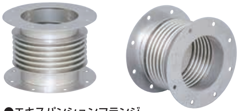
● エキスパンションフランジ 熱膨張による配管の伸縮を吸収できるフランジです。 (MODEL:高温熱風発生機 TSK-52HT 吐出口用 口径φ100)