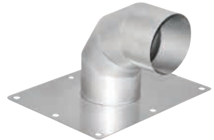
● 四角フランジ付90° エルボ 各種管材にご指示いただいたフランジを取り付けます。