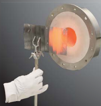
パンチングプレートを瞬時に加熱