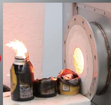
アルミ缶を瞬時に燃焼

豊富な販売実績と技術を、お客様の要望を満たすようにコンサルタントを提供します(無料) お客様に実感いただけるよう社内実験できます。デモ機もご用意しております。